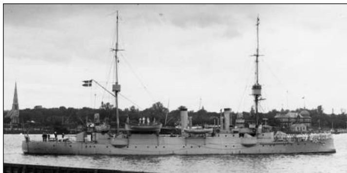
Geyser var en let krydser