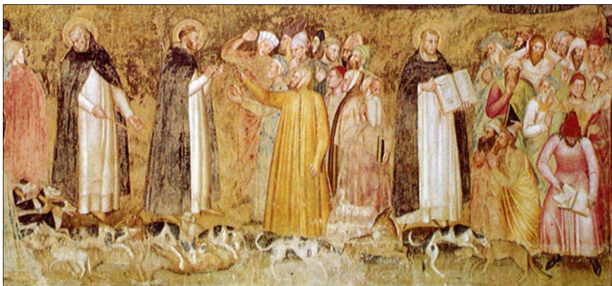
Prædikebrødre forklarer Guds Ord for menigheden, mens Dominiks hunde ( Domini canes? ) beskytter fårene fra ulve og ræve. Detalje fra vægmaleriet 'The Church militant and triumphant' på den højre væg i Det Spanske Kapel i dominikanerkirken Santa Maria Novella i Firenze. Fresko af fr. Andrea da Firenze OP, ca. 1365-67.