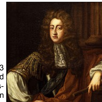
To gange Prins Jørgen til hest og et portræt af prinsen

Prins Jørgen knyttede yderligere i 1683 nære bånd mellem Danmark og England ved at gifte sig med den engelske prinsesse og senere dronning, Anne. Som en slags bryllupsgave komponerede den engelske komponist Henry Purcell: Prins Jørgens March.