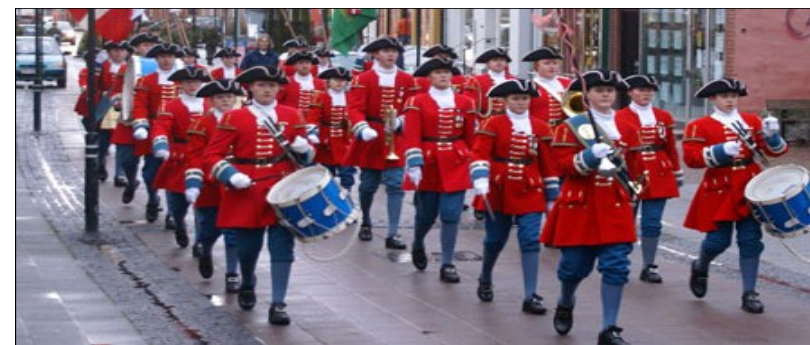
Prins Jørgens Garde marcherer gennem byen

Som mål satte man sig, at garden skulle være en tro kopi af Prins Jørgens Regiment, og i samarbejde med Tøjhusmuseet blev der syet uniformer, som er nøjagtige kopier af de originale.