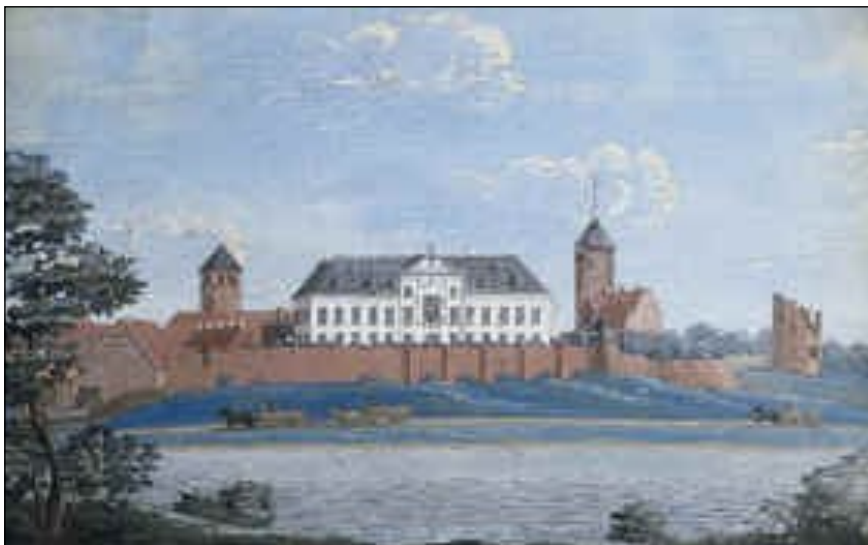
Midt på højborgen rejstes i 1670'erne Prins Jørgens barokpalæ. Prinsen forlod Danmark i 1683 efter sit ægteskab med dronning Anne af England og Skotland, og derefter stod slottet tomt

Prins Jørgens Garde blev således et levende minde om den onde tid og navnlig en påskønnelse af befrielsen fra det tyske åg.