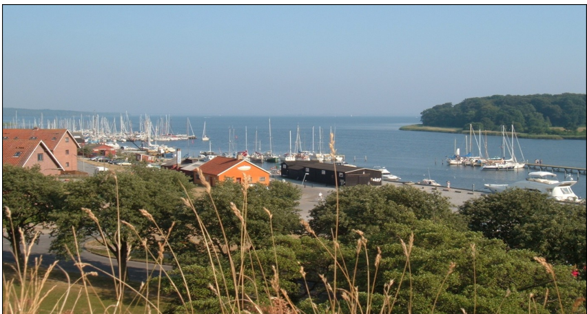
I baggrunden ses halvøen Oringe, som har givet byen sit navn

Vordingborg ér altså "Borgen ved bredden".