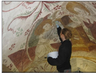
Vor Frue kirkes renovering 2010-2011