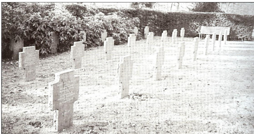
Tysk soldatergrave på Vordingborg Ny Kirkegård.

De mildeste tilfælde blev hjemsendt. Omkring 200 sendtes til Sct. Hans