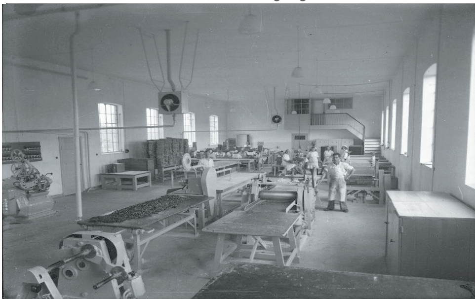
En af de store pakkehaller i Kanold

Lige efter krigen erhvervede og etablerede Flødekaramel-fabrikken Kanold, Marienbergvej 128, sig i en af de gamle ejendomme ved siden af den gamle station i Masnedsund. Matr.nr. 180 og 181, Vordingborg Købstad Ore og Gallemaeder blev købt for 60.000 kr. af Vordingborg Kommune.